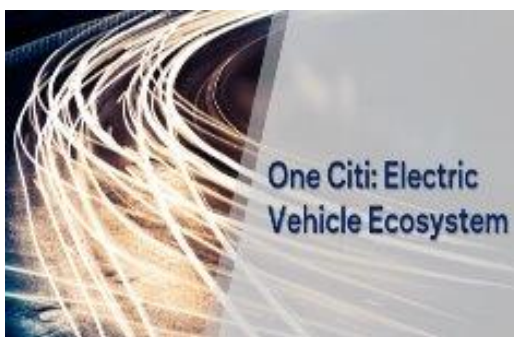
花旗集團全面多樣的旗下產品，再加上遍佈於全球各地的據點，在支持客戶邁向成長和轉型上，尤其具有與眾不同的地位與優勢。